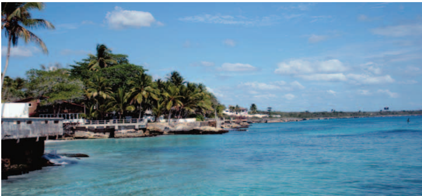
Boca Chica

Les lieux d'activités nocturnes possèdent une vaste gamme de restaurants situés dans les rues principales de Boca Chica, Guayacanes et Juan Dolio. Parmi es restaurants sont le traditionnel Boca Marina et Neptuno à Boca Chica, El Sueño et Deli Swiss à Guayacanes, et Con Con et Meson Español à Juan Dolio où l'activité nocturne se prolonge jusque tard dans la nuit. On y retrouve également des casinos et une dizaine de discothèques dans les environs.