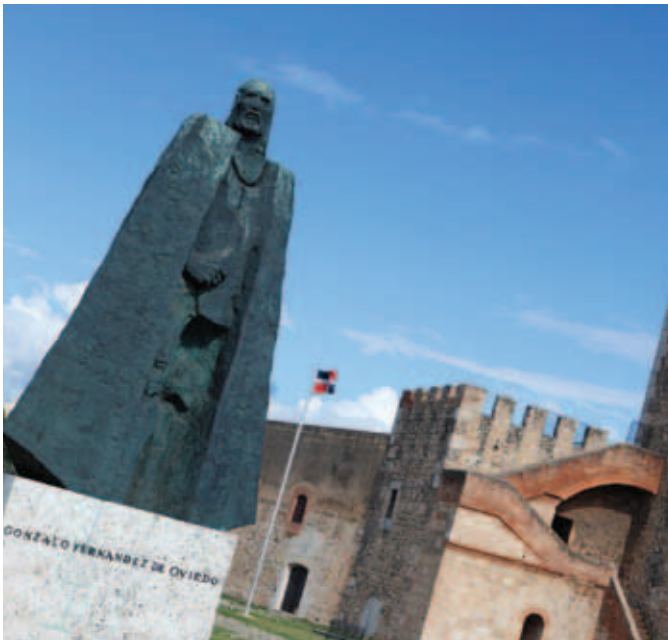
Fortaleza Ozama

comme en avril-mai, la Foire Internationale du Livre.