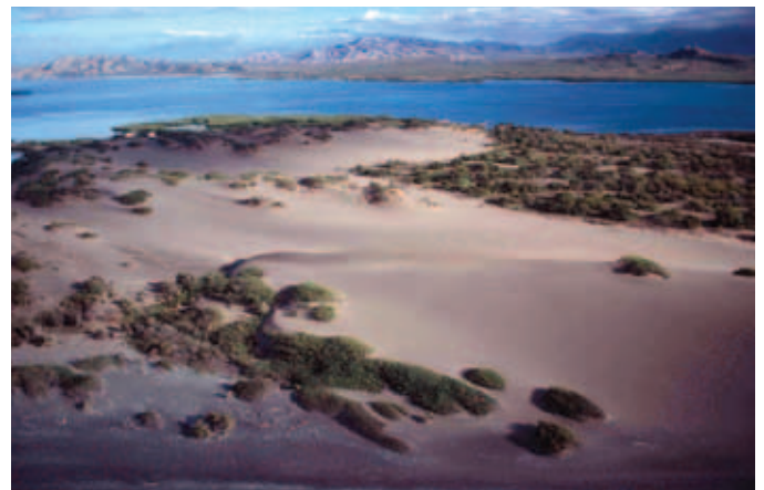
Dunas de Bani