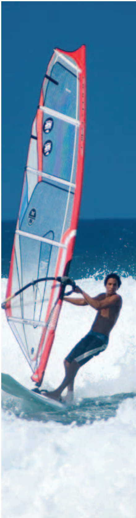
Cabarete

et Air Transat (Halifax, Montréal, Québec et Toronto), West Jet (Toronto).