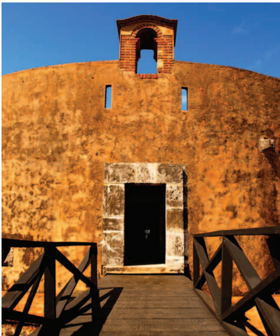
Fuerte San Felipe

Playa Dorada. Les touristes qui séjournent dans les hôtels de Playa Dorada ont l'habitude de prendre un pot pendant le spectacle avec les amis ou la famille. Pour les noctambules, les portes s'ouvrent au Café Hemingways, au Roadway et au Coco Bongo, à Playa Dorada Plaza. Les DJ mélangent la musique internationale avec la musique locale.