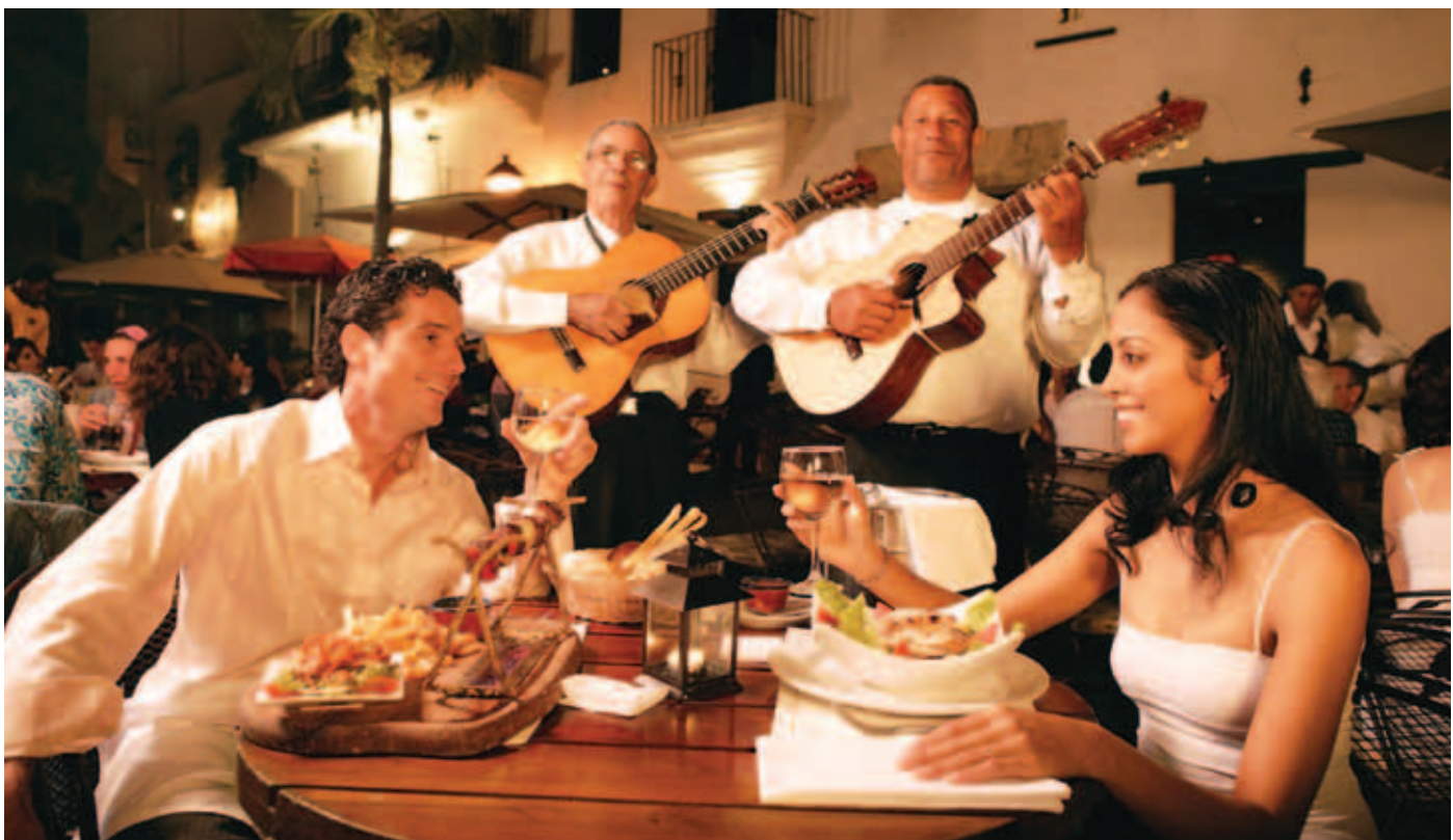
Pate Palo Zona Colonial

Place de la culture. Une oasis verte au cœur de la ville où différents musées et centres culturels y sont accolés comme le musée de l'Art Moderne, le musée de l'Homme Dominicain et le Théâtre National. On y présente souvent des œuvres du patrimoine national ou des pièces internationales. Sur les grandes places, des foires sont célébrées