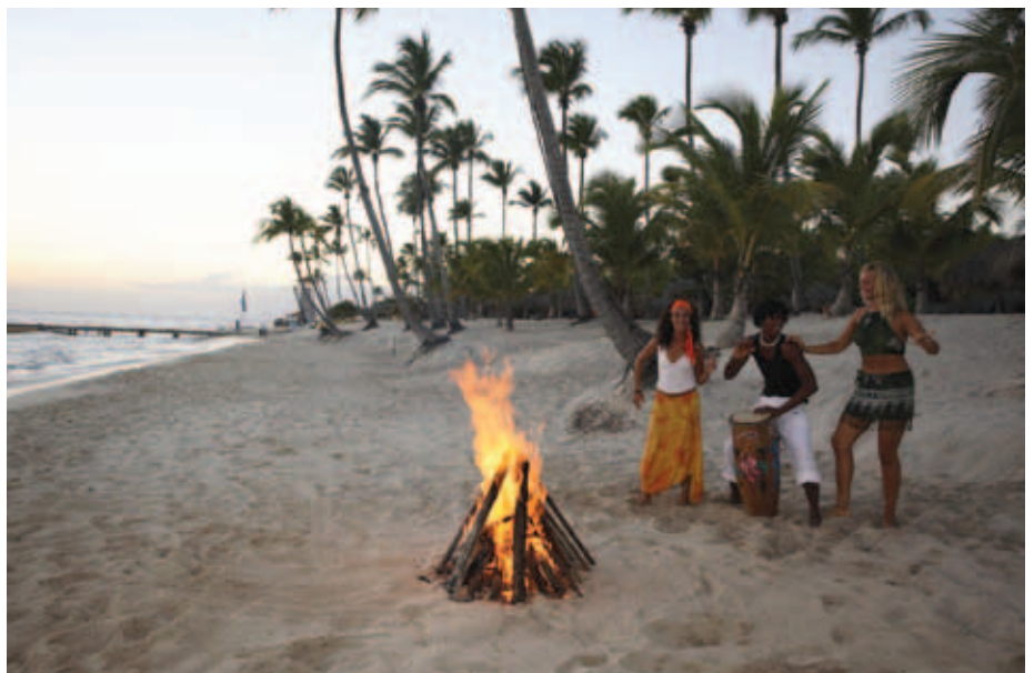
Bayahibe

Le village et la plage de Bayahibe. Bayahibe est un petit village de pêcheurs avec sa plage. C'est un lieu exotique et pittoresque avec un chapelet d'hôtels, de restaurants et de boutiques. D'ici démarrent