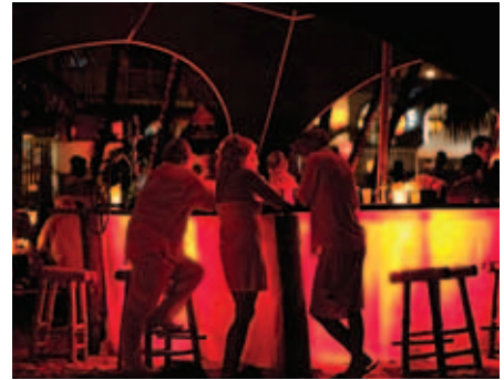
Cabarete