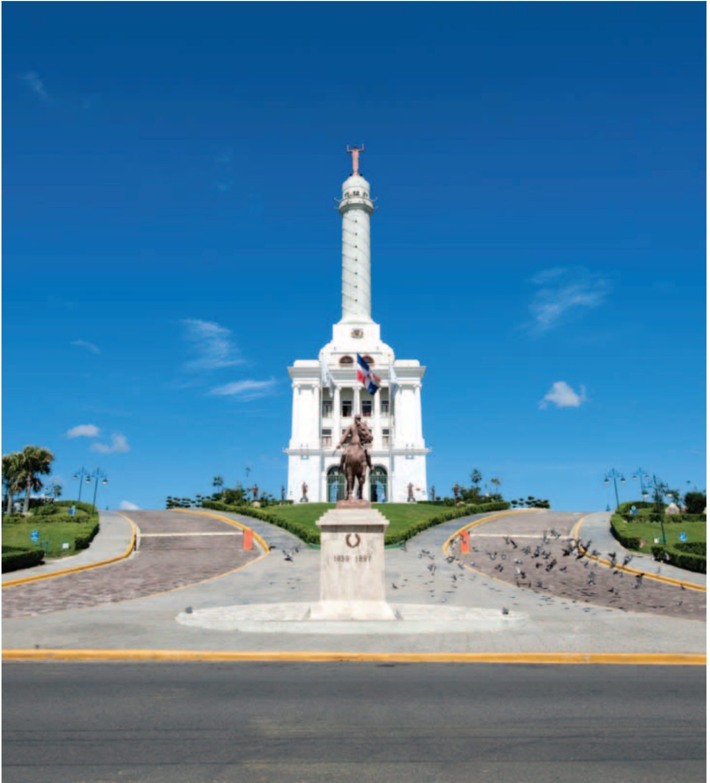
Monumento de Santiago

Ville-Couer, centre agricole et industriel, la culture, la gastronomie, le carnaval, les cigares, les typiques merengue, le campus universitaire, tourisme médical...