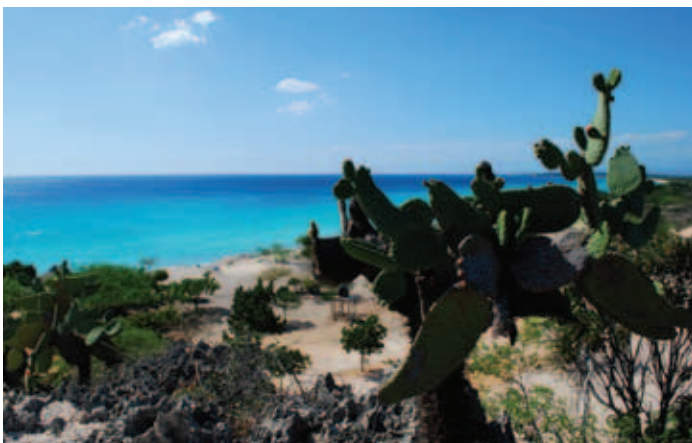
Bahía de Las Águilas

Étant donné la nature active de cette destination, pas beaucoup des activités nocturnes. Les activités sont limitées aux discothèques qui jouent de la musique latine et dominicain et bars à bière dans les villes de Barahona et Pedernales. Pour la plupart des restaurants et calmes repas, se mêlant à restaurer les forces pour le lendemain sont disponibles.