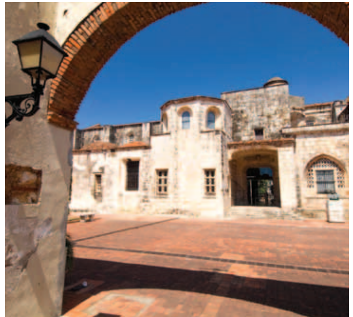
Catedral Santa María de la Encarnación

L'Aquarium National. A peu de distance du Phare de Colomb, et en recréant l'idée d'un parc pour enfants, l'Aquarium présente des espèces marines pour adultes