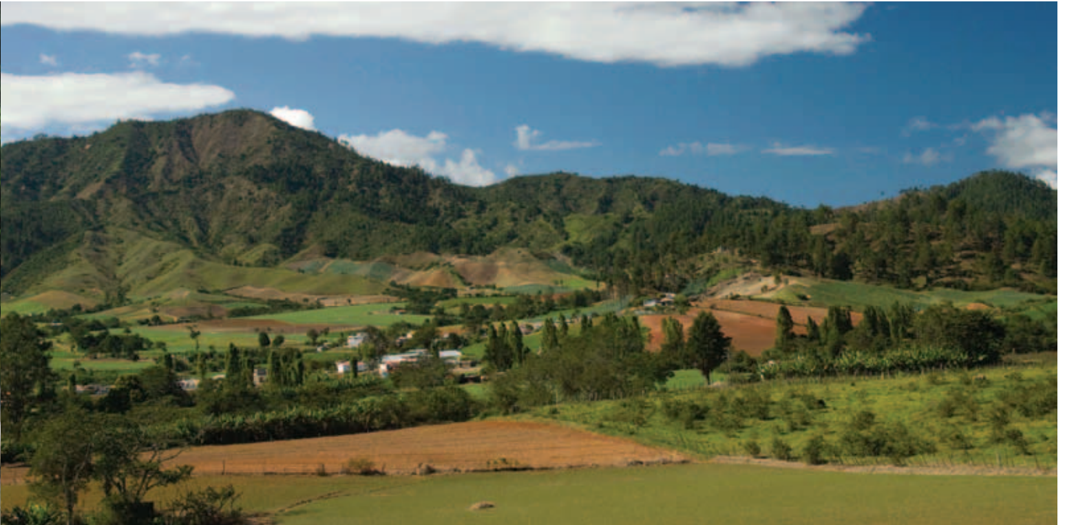
Jarabacoa

Duarte. En temps normal, la température peut osciller entre 12 et 21°C (avec l'altitude, la température peut descendre tôt le matin en dessous de 0°C).