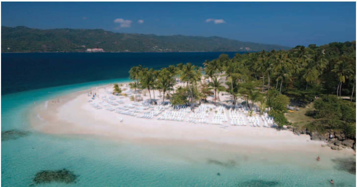
Cayo Levantado

La vie nocturne à Samaná est située majoritairement dans les restaurants, bars à bière "centros cerveceros" et les "colmaciones" fréquentés par la jeunesse qui travaille dans les centres touristiques de la région. Cependant les restaurants de plage et les discothèques sont très animés, la population locale et les touristes y vont pour danser le merengue, la salsa et la bachata et déguster des cocktails originaux.