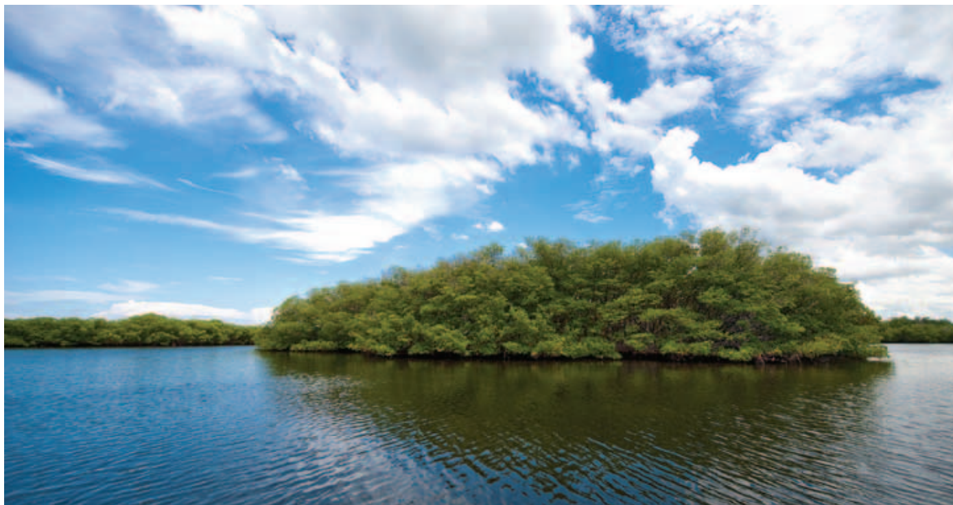
Manglares Punta Rucia

Visiter le Musée de l'Ambre pour acheter des bijoux de qualité avec le l'ambre authentique et à des prix raisonnables. Le marché de la ville, sur la colline, est