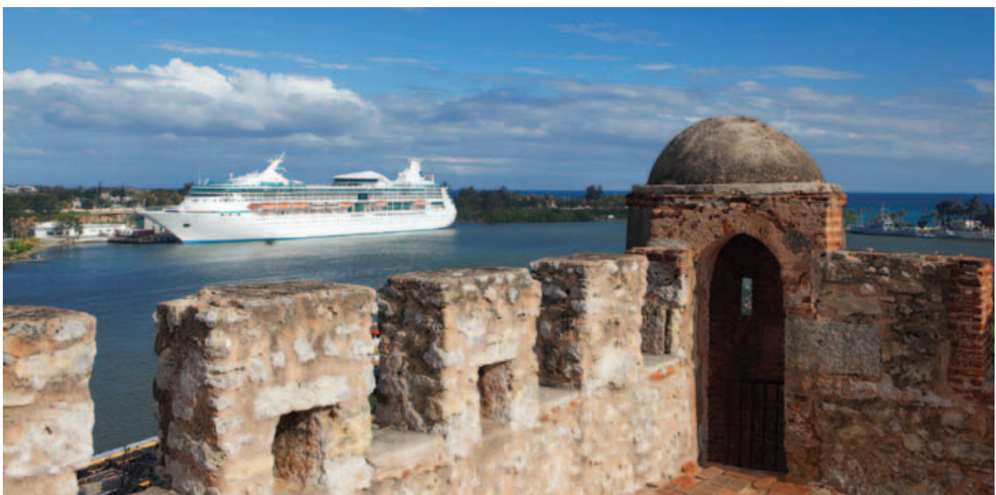
Torre del Homenaje, Fortaleza Ozama

Dans la capitale, on peut célébrer des congrès réunissant plus de 2,000 personnes dans les grands salons des principaux hôtels tels que le Dominican Fiesta et le Renaissance Jaragua. Les hôtels Occidental El Embajador, Meliá Santo Domingo, Barceló Santo Domingo, Holiday Inn Santo Domingo, Courtyard Santo Domingo, Hilton Santo Domingo y el Intercontinental V Centenario offrent aussi des facilités pour