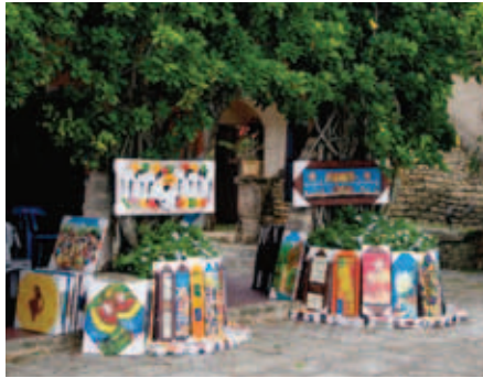
Altos de Chavón