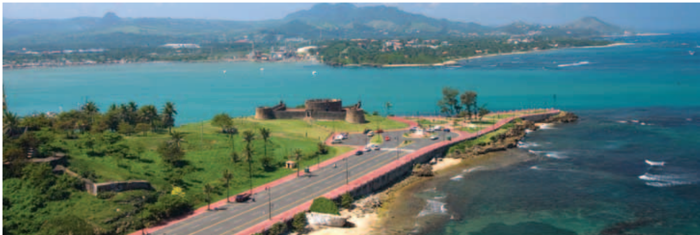
Malecón & Fuerte de San Felipe, Puerto Plata

aventuriers sur une distance entre 100 et 300 mètres avec une vitesse de 50 noeuds et une hauteur de plus de 100 pieds.