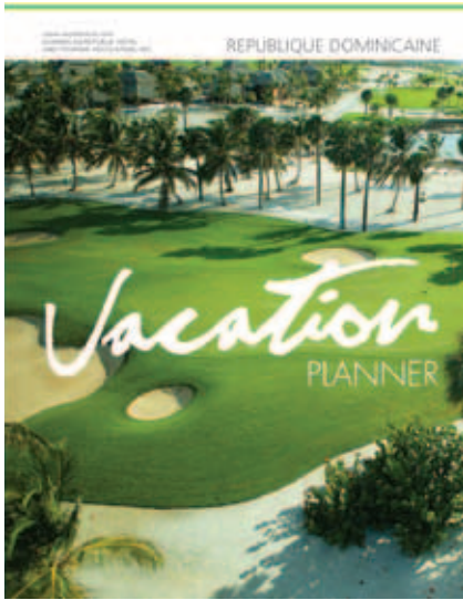
Portail: Le Punta Espada de Cap Cana