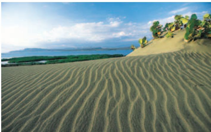
Dunas de Bani

Hoyo de Pelempito. De plus en plus surprenant pour ceux qui feront le chemin entre les bosquets secs et les cactus fleuris sur la route d'Oviedo à Pedernales. Ils seront remplacés par des forêts de pins à