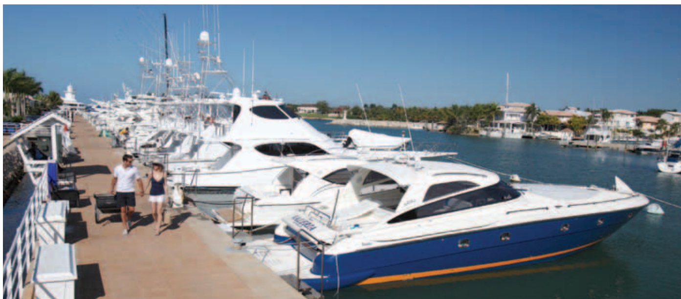
La Marina, Casa de Campo

La Romana. La ville offre une grande variété de restaurants, de bars et de discothèques. Bayahibe. Ses résidents et touristes se réunissent dans les restaurants et les «colmadones» ou bars à l'air libre.