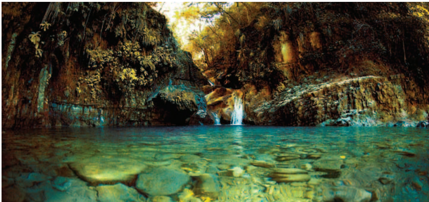
Charcos de Damajagua

A Puerto Plata, on peut admirer l'architecture de style victorien. Plus de 150 maisons construites entre la fin des années 1800 et le début des années 1900 prônent en plein centre ville, et plus particulièrement autour du Parc Central.