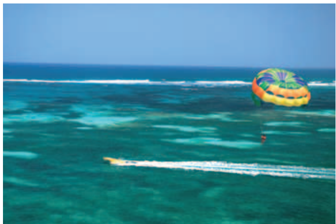
Playa Costa Este