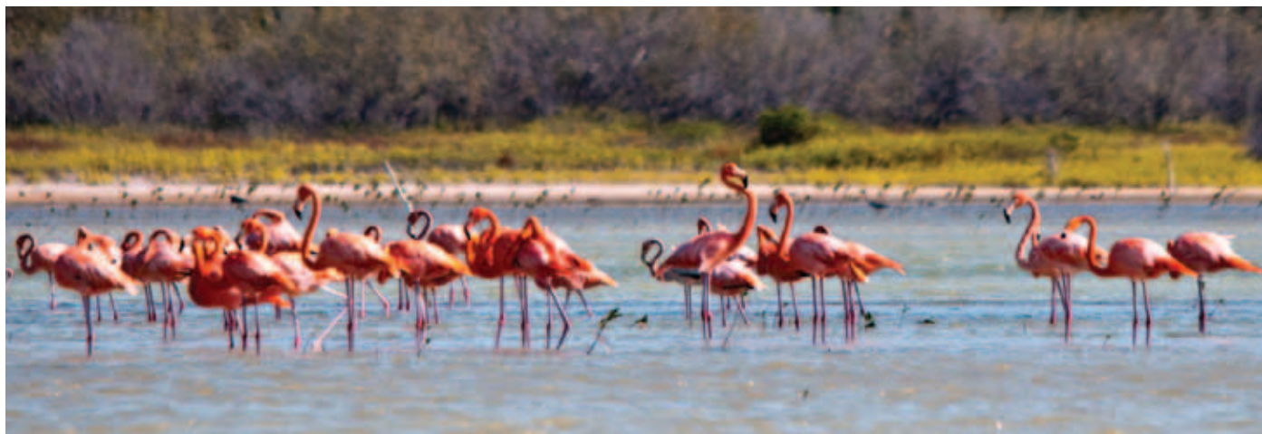
Laguna de Oviedo

La région de Barahona-Pedernales offre la plus grande biodiversité du pays. Grâce à ses richesses naturelles, cette partie du sud-ouest est protégée et sera la future destination de tourisme écologique dans les Caraïbes. Aujourd'hui, l'Homme porte un regard différent sur la nature et lui accorde un grand intérêt.